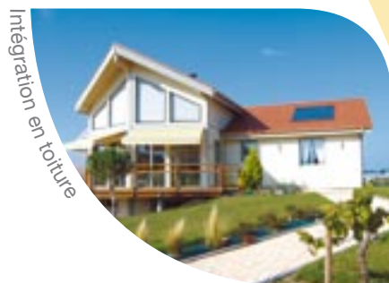
Intégration en toiture

Les vitres du capteur sont assemblées de telle manière que la pluie s'écoule naturellement, sans retenue, et nettoie le capteur.