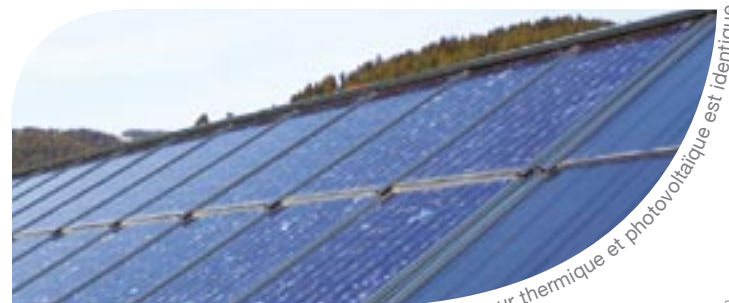
La structure du capteur thermique et photovoltaïque est identique

Grâce à l'offre photovoltaïque CLIPSOL, devenez producteur de votre électricité et réduisez vos factures sans polluer.