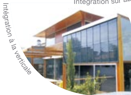
Intégration à la verticale