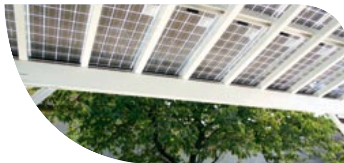
* verrière non isolée thermiquement

Equipé du module transparent, le capteur photovoltaïque CLIPSOL fait office de Verrière.