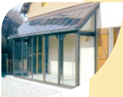
Intégration sur abri